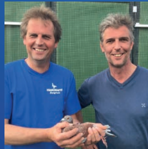
Gebroeders Desbuquois (BE)

1 er Zone Argenton nationale 7061 pigeonneaux