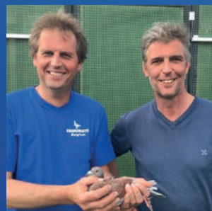
Gebroeders Desbuquois (BE)

1° Nationaal Zone Argenton 7061 jonge duiven